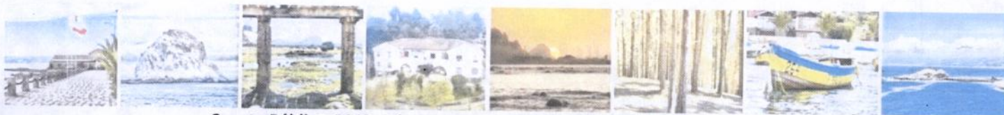
Cuenta Pública 2009 Ilustre Municipalidad de Algarrobo

7.- Con fecha 29 de octubre 2009, mediante Oficio N°005903, la Contraloría Regional de Valparaíso remite, informe Final N°77. Metodología: "El examen se práctico de acuerdo con la Metodología de Auditoria de este organismo Superior de Control, e incluyo el