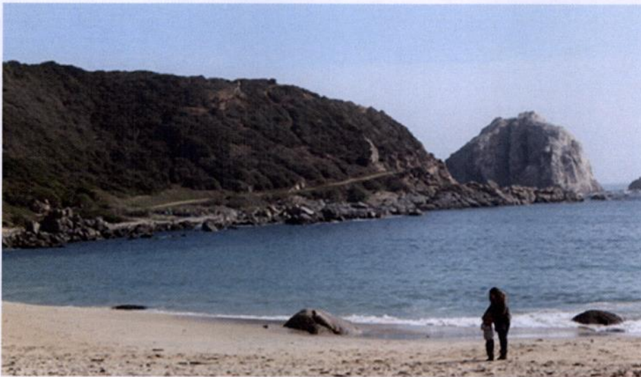
ACTIVIDADES PROGRAMADAS PARA EL 2DO SEMESTRE 2017