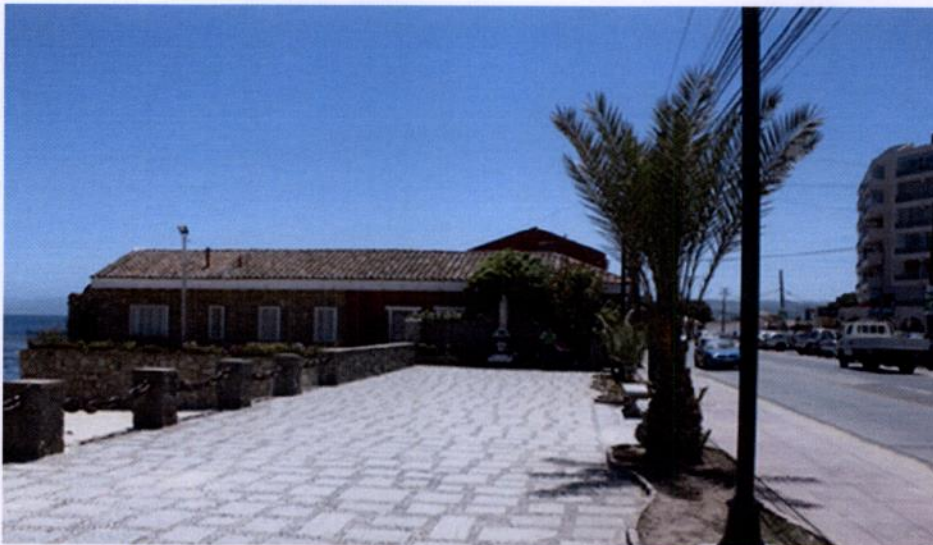
B:- ACTUACIÓN COMO CONTRAPARTE TÉCNICA: