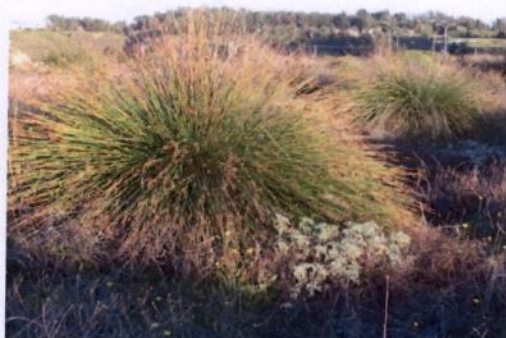
Juncus acutus , juncos dunarios