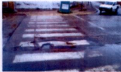
SITUACIÓN ACTUAL Desembocadura Calle Santa Teresita