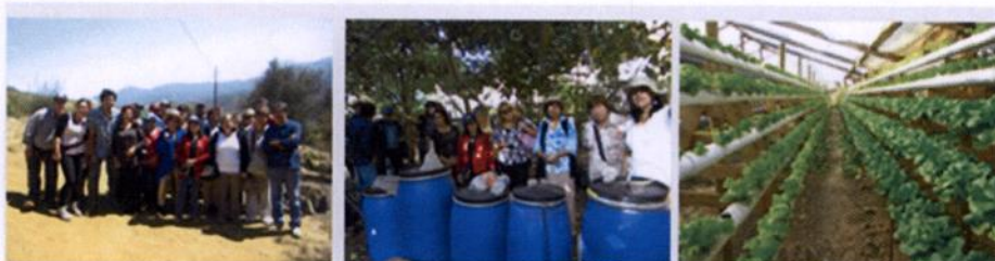
Gira Agricultura Limpia