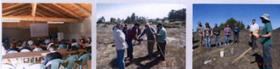
Capacitación en Agricultura Limpia y cosecha de aguas lluvias