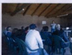
Charla Buenas Prácticas Agrícolas en el Manejo de Fitosanitarios de AFIPA