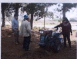
Recibimiento de gira técnica de PRODESAL Machali